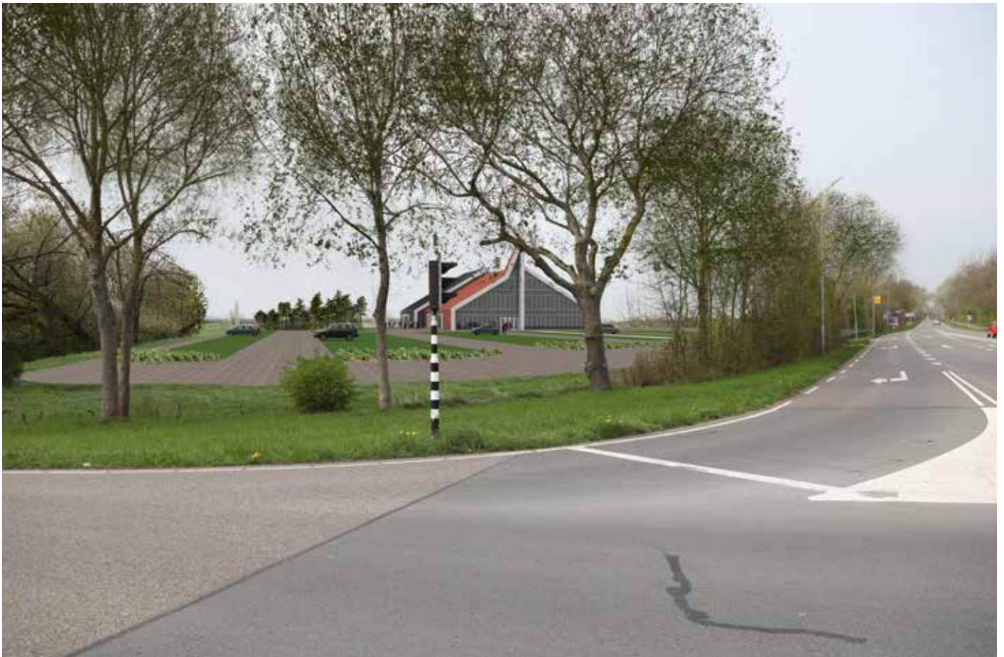
Zicht op de nieuw te bouwen kerk vanaf de kruising Laan der Verenigde Naties en Sandberglaan

Als laatste doen we nog een oproep aan allen die graag mee willen helpen in de vorm van arbeid en materieel. Als het er nog niet van gekomen is om je op te geven, doe dit dan in de komende weken. Zo kunnen we naar de zomer toe inventariseren hoeveel mensen we kunnen verwachten en bij welk soort werkzaamheden zij ingezet willen worden. Een formulier hiervoor en ook andere informatie over de nieuwbouw kun je vinden op www.nieuwbouwontmoeting.nl .